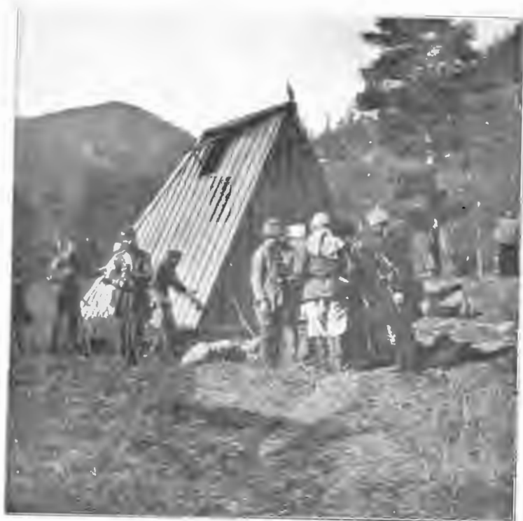
Въ лагерѣ Кубанской охоты. Ранний утро.