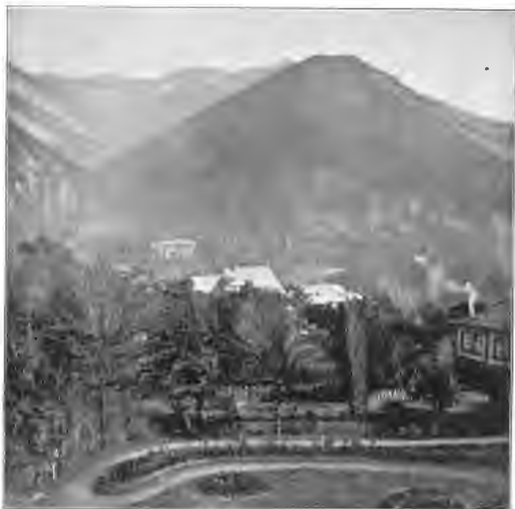
Охотничі паркъ Боржомѣ, 1900