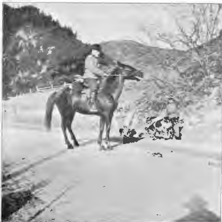
Въ Боржомъ. У охотничьей сторожки. Фотогр. М. В. Андреевскій, во время охоты въ 1902 г.