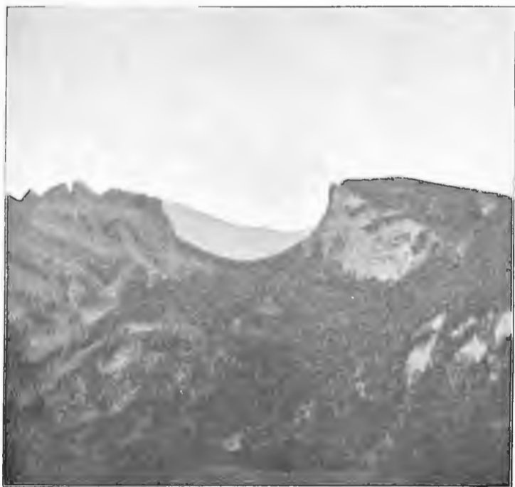
Кубанская Императорскаго Высочества Великаго Князя Сергѣя Михайловича. чертовы воротъ.