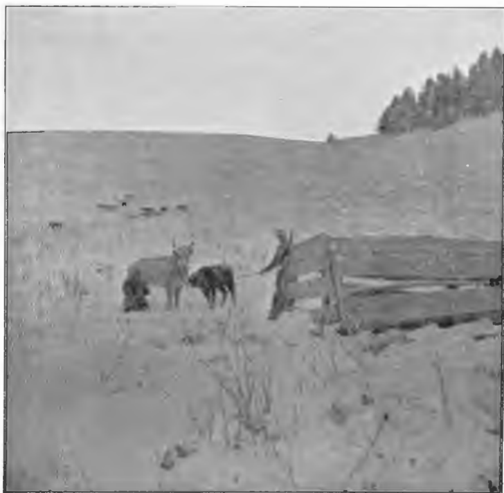
Въ Кубанской охотѣ Р. Императорскаго Высочества Великаго князя Сергѣя Михайловича. Доение коровъ.