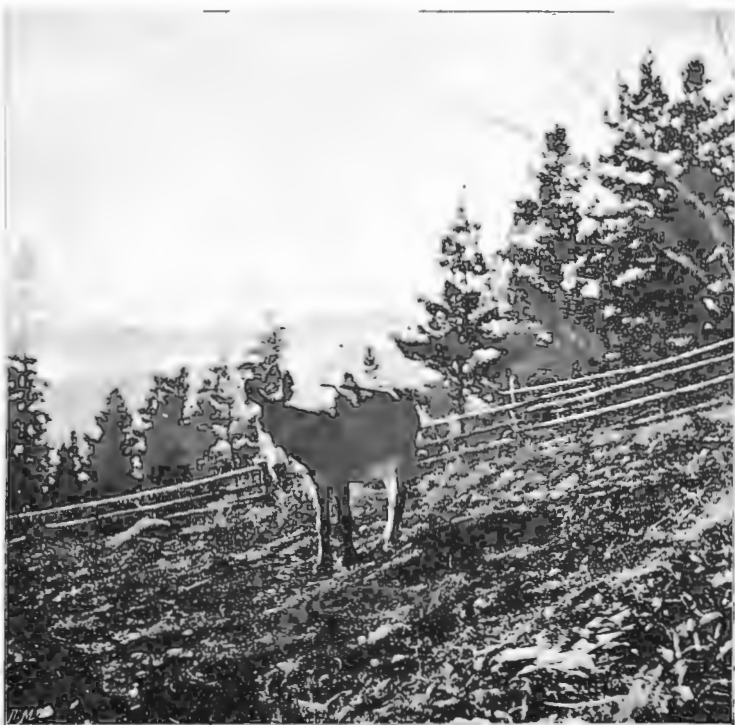
Въ Боржомъ. У охотничьей сторожки. во время въ 1902 г.