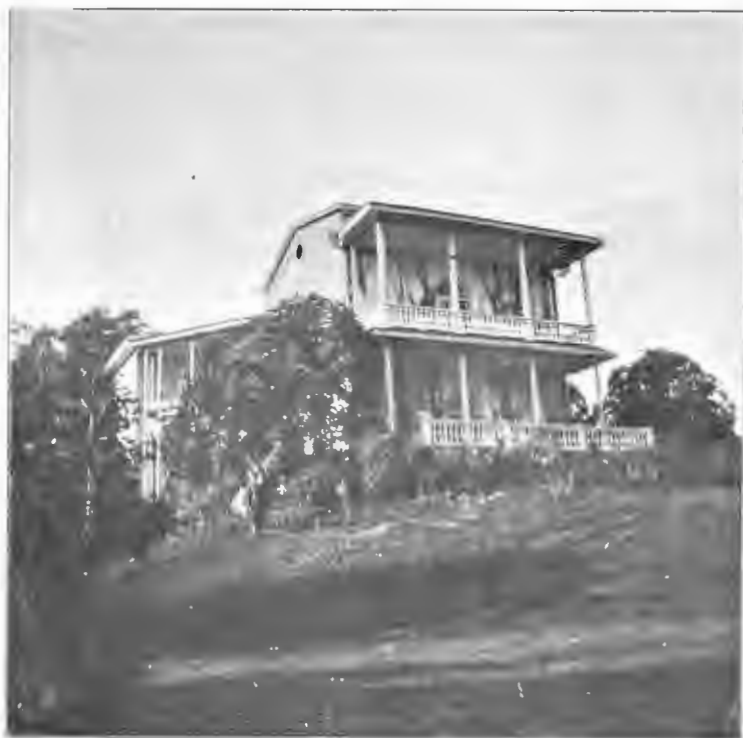
Дворецъ въ Боржомѣ, паркъ наследнаго звѣрмяи. Фотогр. М. В. Андреевскій въ 1902 г.