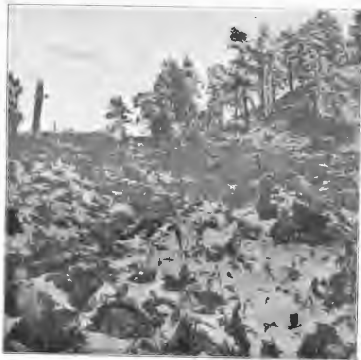
Виды по пути въ горы въ Кубанскую охоту.