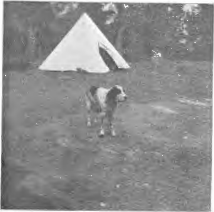
Охотничья палатка охотѣ горахъ Кавказа