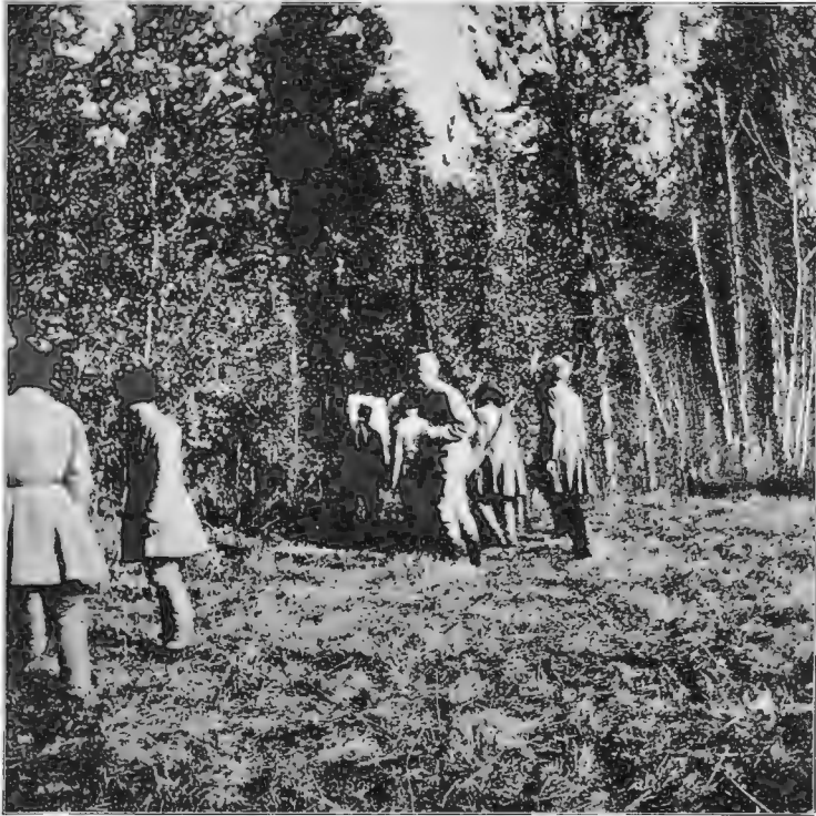
Его Императорское Высочество Великій Князь Сергѣй Михайловичъ охотѣ Боржомѣ 1902 г. Разстановка померамъ.