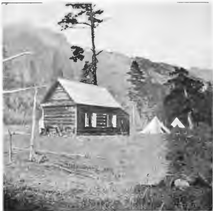
Лагерь охоты Кубанской охоты Его Императорского Высочества Великого Князя Сергѣя Михайловича.