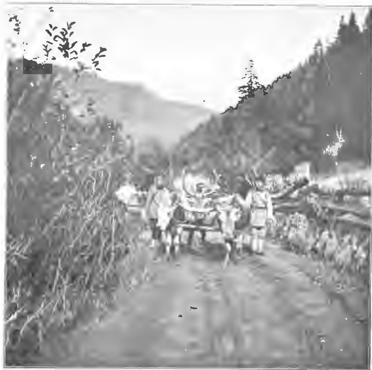
Охота въ Боржомѣ, на Кавказѣ. Вывозъ убитыхъ звѣрей изъ лѣса. 1902 г.