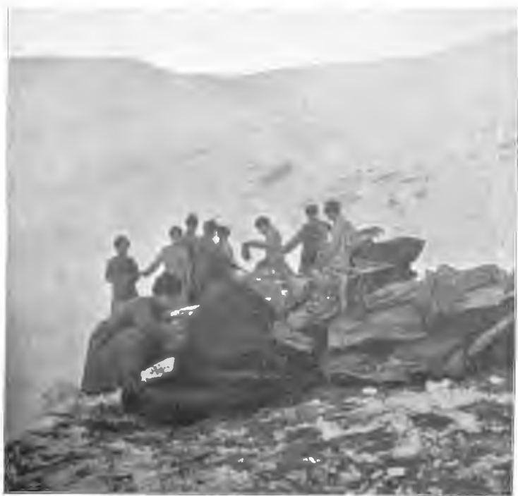
Въ Кубанской охотѣ Его Императорскаго Высочества Великаго Князя Сергѣя Михайловича . Охотничья команда на привалѣ.