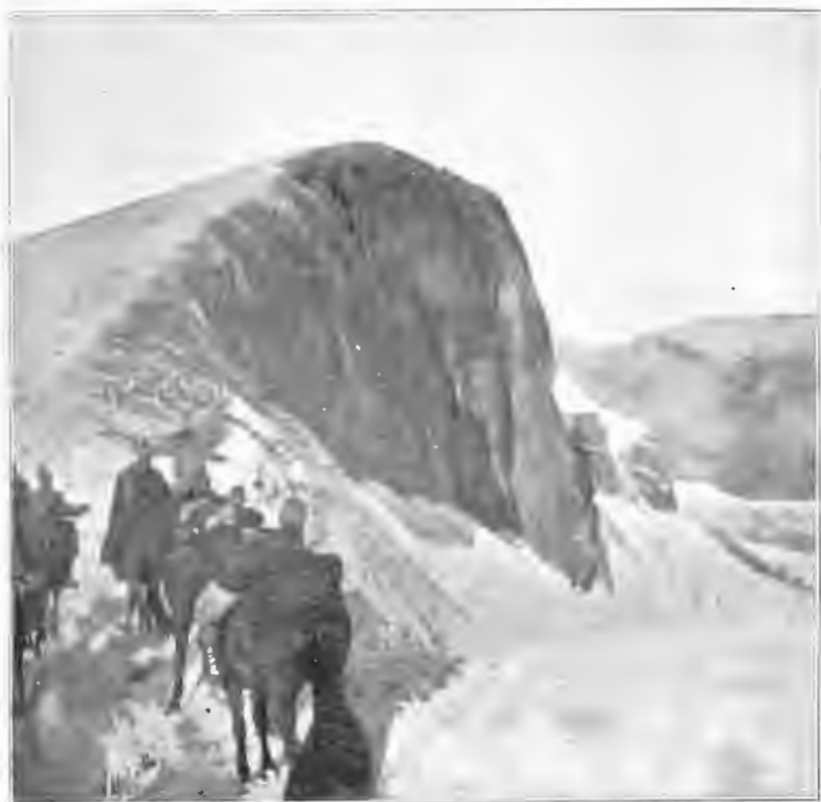
Переводъ изъ одного лагеря другой Кубанской охоты.