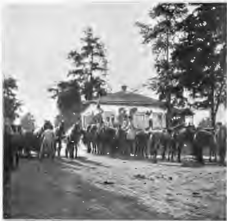
Псебай Кубанской области. Охотничья команда Е. Императорск. Высочеств. Великого Князя Сергѣя Михайловича.