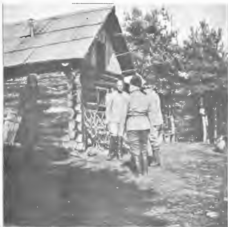
Его Императорское Высочество Великій Князь Сергѣй Михайловичъ Боржомъ (Самкаль)